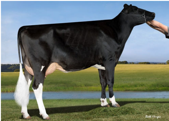
IHG WINNEY JEROD 55380 GRANDDAM